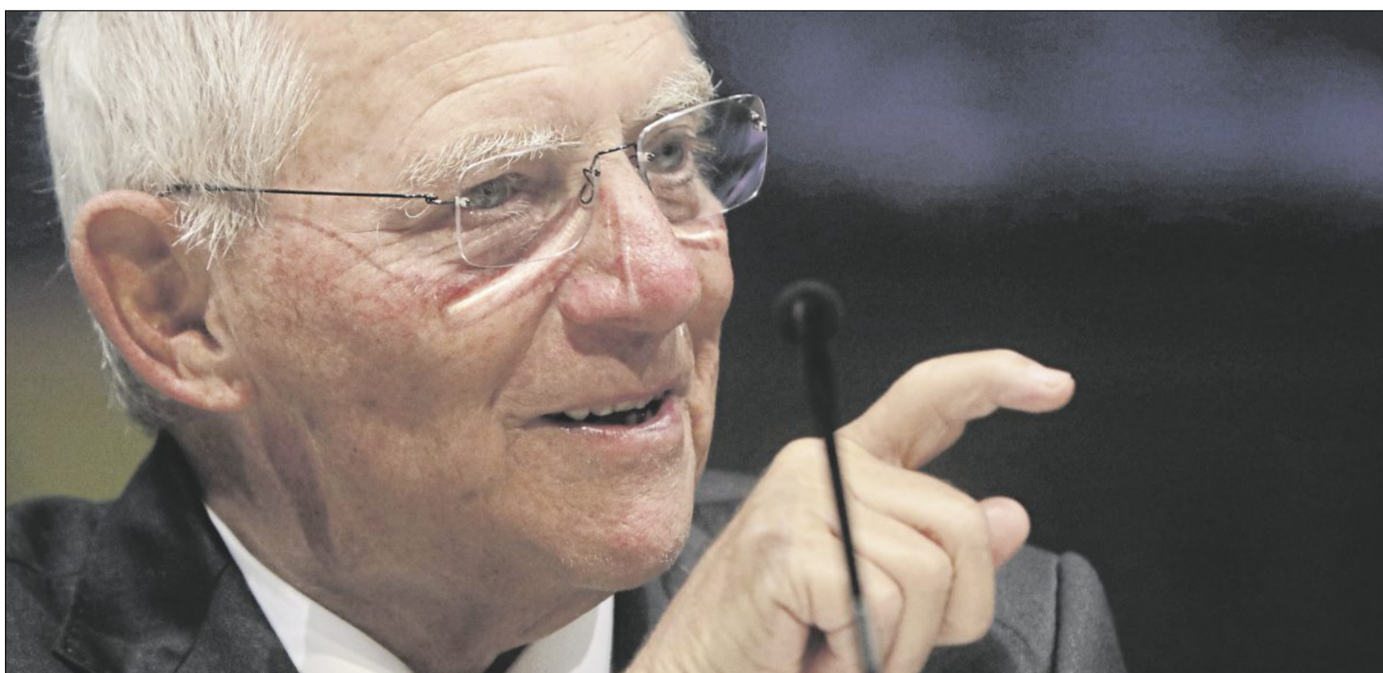
Wolfgang Schäuble in Schorndorf: Weder anbiedernd noch besserwisserisch und angenehm unverschwurbelt in der Wortwahl.

Waiblingen. Autodiebe entwendeten zwischen Dienstagabend, 18 Uhr, und Mittwochmorgen, 8 Uhr, einen Oldtimer, der auf einem Firmengelände in der Düsseldorf Straße in Waiblingen abgestellt gewesen war. Bei dem Pkw handelt es sich um einen gelben Mercedes-Benz SEB Coupé im Wert von rund 40 000 Euro. Zur Tatzeit waren die amtlichen Kennzeichen S-JX 111H am Fahrzeug angebracht, wobei natürlich die Möglichkeit besteht, dass diese inzwischen gewechselt wurden. Zeugenhinweise nimmt die Kriminalpolizei Waiblingen unter der Telefonnummer 0 71 51/95 00 entgegen.